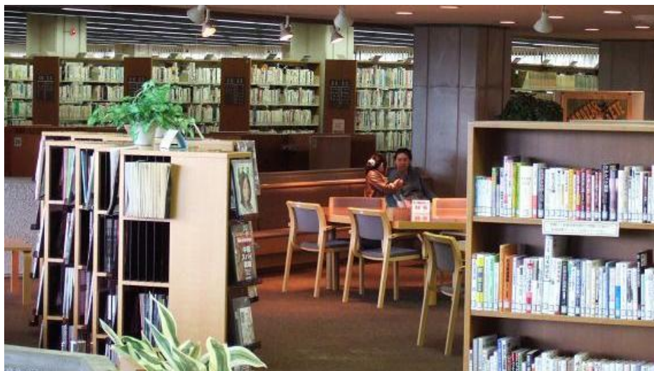
2階ブラウジングコーナー・新着図書コーナー